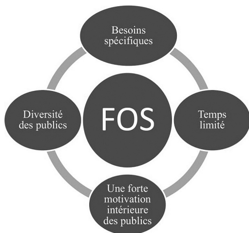
Figure 2. Caractéristiques du FOS.

Les éléments caractéristiques du FOS ont été exposés dans la figure ci-dessous :